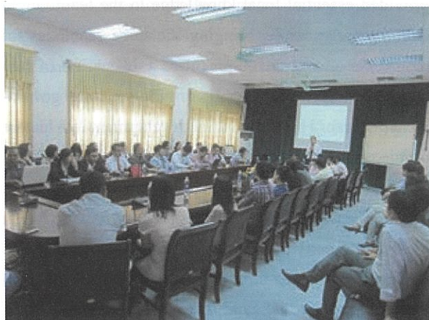
ベトナム同窓会・ワークショップの様子

地球環境学堂・学舎では、平成 17 年よりアジア地域における国際協働の一環として、ベトナムを拠点とした教育研究連携を展開し、研究・教育拠