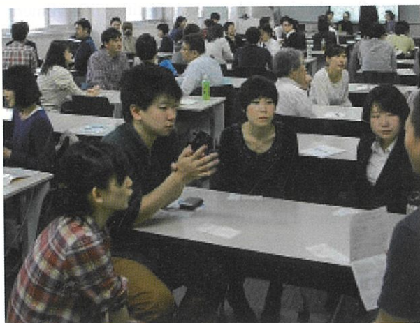
グループディスカッションのひとこま