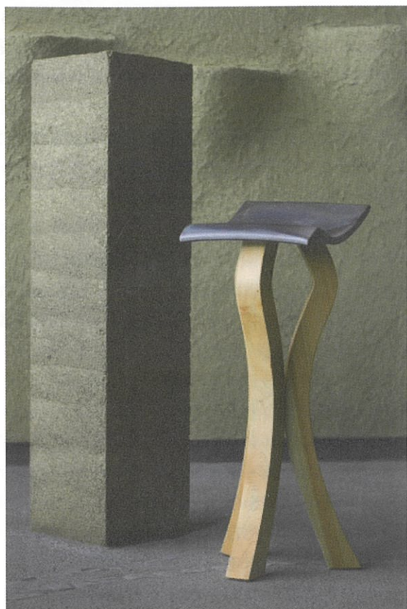
ギャラリーに置かれた瓦の椅子

ておられる方などから、多彩な見解や質問が出され、いつも以上に厚みのあるやりとりが行われました。議論は尽きることなく、惜しみながらの閉会となりました。