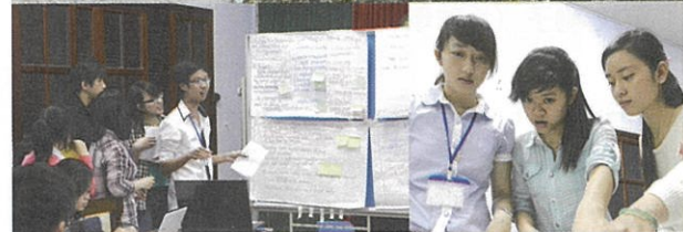
Students ask, "How sustainable is my town?"