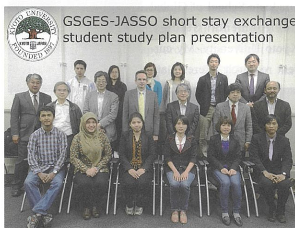
Group photo of the six special auditing students, their supervisors and colleagues.

On 24 April 2013, we held the Japan Student Services Organization (JASSO) short stay exchange student study plan presentation meeting at Kyoto University. Six students – all of whom you can meet below – gave a 10 minute presentation followed by five minutes each for questions and comments. The 25 participants at the meeting then enjoyed a lively 90-minute discussion.